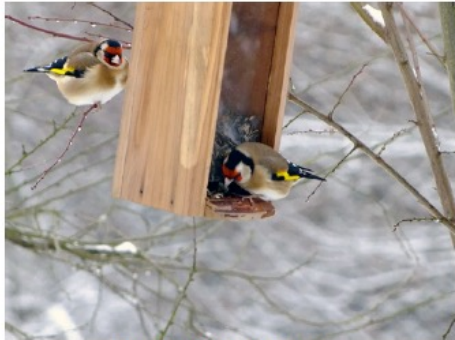
couple de chardonnerets